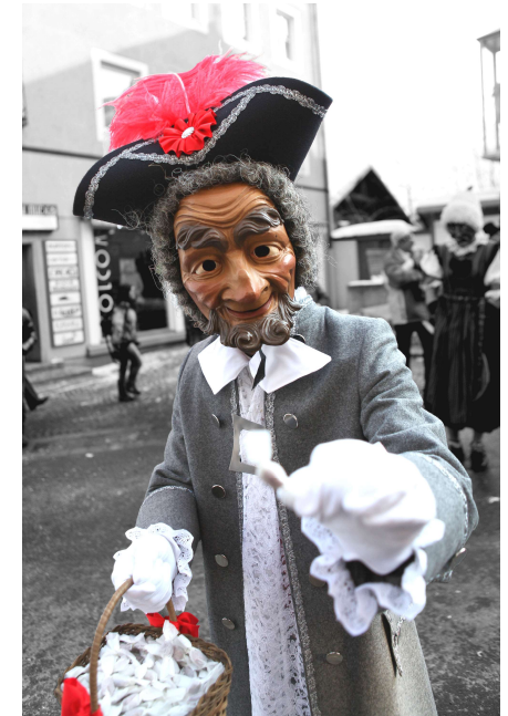
Wolfgang als Altfrankspritzer